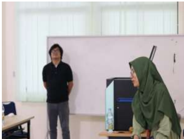
Gambar 4 Pelatihan Menggunakan Mesin 3D Printing