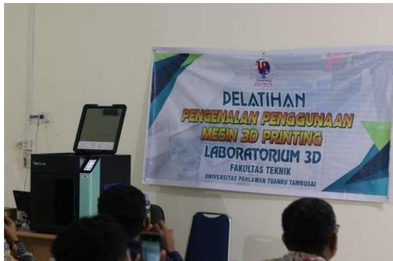
Gambar 2 Pengenalan mesin 3D Printing