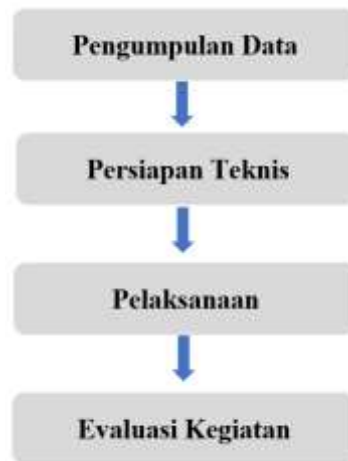
Gambar 1 Tahapan Kegiatan